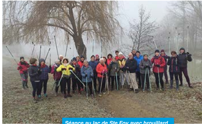
Séance au lac de Ste Foy avec brouillard