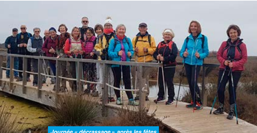
Journée « décrassage » après les fêtes